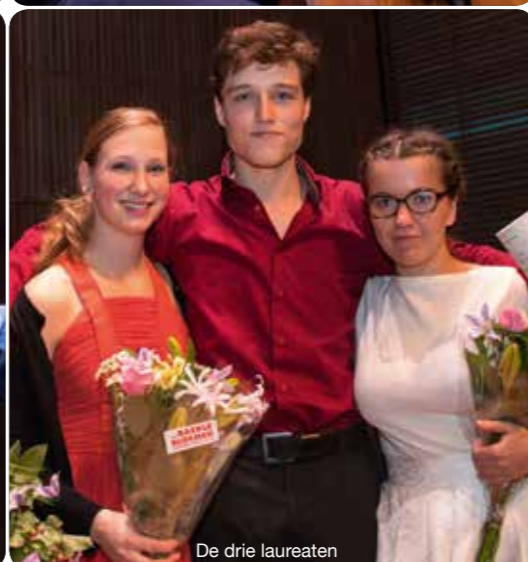
De drie laureaten