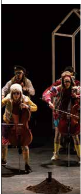
들에게 지적, 정신하는 내용들은 그 자체로...