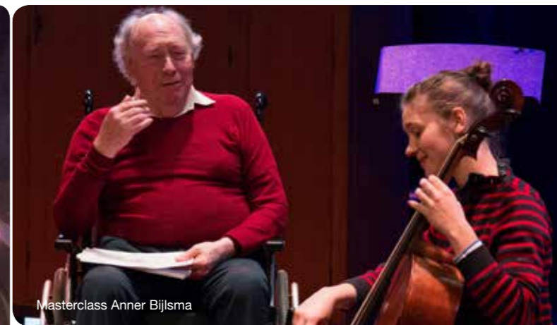
Masterclass Anner Bijlsma