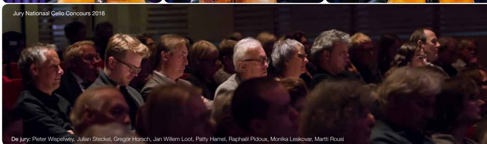
Jury Nationaal Cello Concours 2016