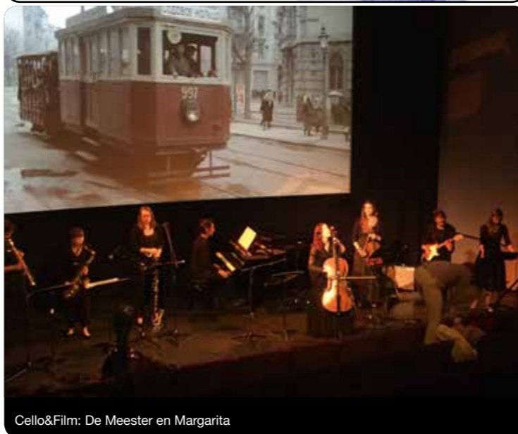
Cello&Film: De Meester en Margarita

Cello&Film wordt mogelijk gemaakt door: AK