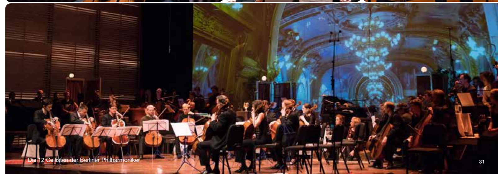
Die 12 Cellisten der Berliner Philharmoniker