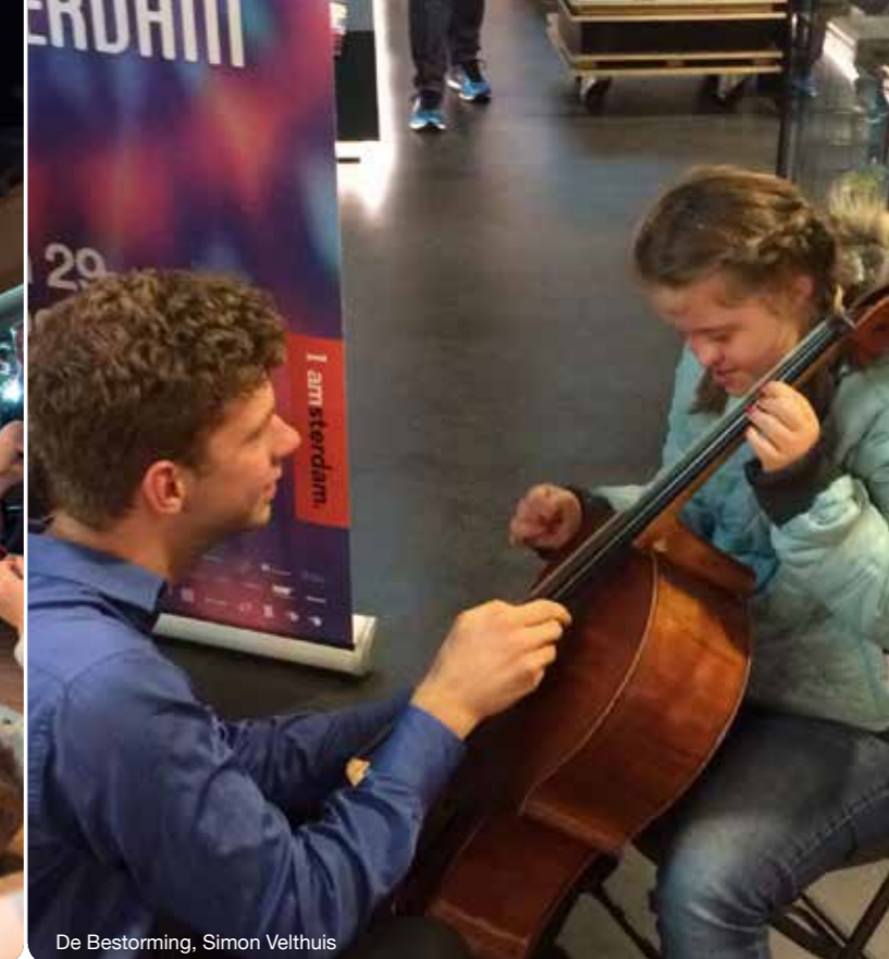
De Bestorming, Simon Velthuis

'Tien dagen lang ronkt, gonst, zoemt, zingt, jankt, gilt, bromt, fluistert, mompelt, monkelt, giert en juicht het mooiste instrument ter wereld in het Muziekgebouw aan 't IJ. Dat kan natuurlijk alleen tijdens de Cello Biënnale Amsterdam.' Het Parool