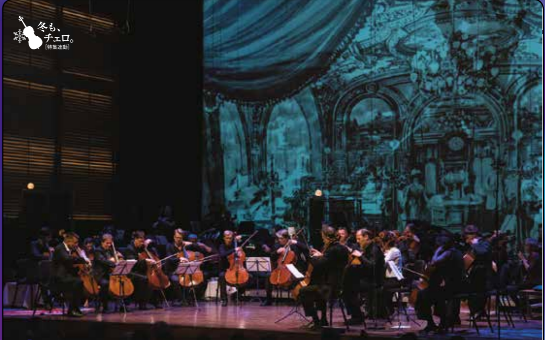
▲음악극에서는 연주뿐만 아니라, 천사와 악마의 역할에도...