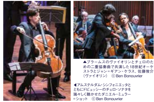
▲암스테르담·시니피에르의 첼로 소나타를 연주했다...