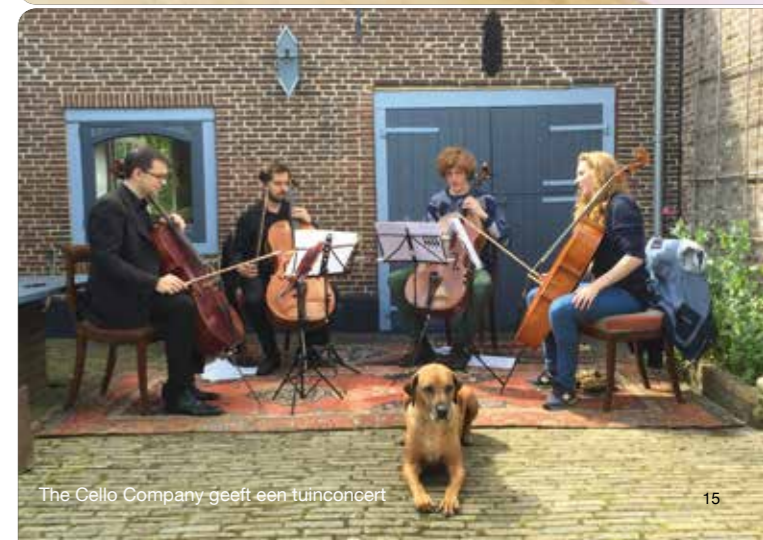
The Cello Company geeft een tuinconcert