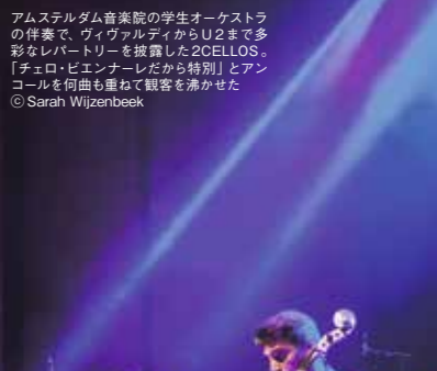
▲브람스의 바이올린과 첼로를 위한 이중 협주곡을 연주했다...