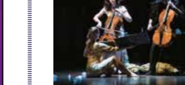
▲음악극에서는 연주뿐만 아니라, 천사와 악마의 역할에도...