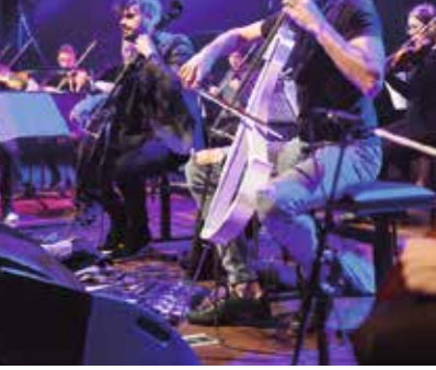
▲암스테르담·시니피에르의 첼로 소나타를 연주했다...

'A unique programme including many musical styles and performed by international stars baffled a large Biennale audience. Young soloists and student-visitors from all over the world enhanced the already very lively and friendly atmosphere of the festival.'